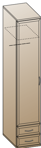
ШК-1022 Шкаф 2224x450x576

Россия, 442965, Пензенская область, г. Заречный, проезд Фабричный, 11, ООО "Мебельная компания "Лером" e-mail: Info@lerom.ru http://www.lerom.ru Тел./Факс: (8412) 65-33-01, 65-33-02, 65-33-03, 65-33-04, 65-33-05 Отдел сервиса: (8412) 65-33-06